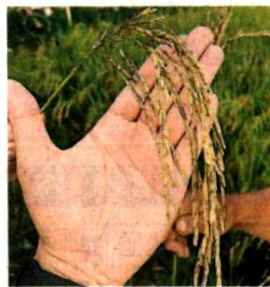
得病了的稻谷稻患空乏。

本价格的暴涨、稻米病毒、害虫肆虐、稻种问题等的影下，让稻农们叫苦不迭、蒙受巨大亏损，也陷窘境。