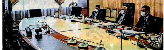
前首相拿督斯里穆希拉欣(左二)主持气候变化行动理事会 (MyCAC)，其中参与者包括州议会内的持有利相关者的支持及取得方向；左为环境及水务部长拿督斯里穆希拉欣。

根据国际自然保护联盟 (IUCN) 数据，2018年全球塑料制造了超过3亿吨塑料，其中至少高达800万吨最终成为海洋中的塑料垃圾及微塑料，对此，政府通过环境及水务部采取行动，以制定立法制度化。 在第十二大计划中，环境及水务部受到政府委托，引领我国绿色经济发展。计划中的第三大主题将专注于加速绿色经济，以推动国家可持续发展、水资源转型以及加强环境治理。 与第十二大计划目标一