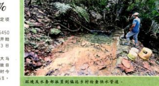
环境及水务部负责到偏远乡村检查供水管道。

在25份报价单中，共有18份涉及环境修复，降低洪水风险。其余7项则涉及机电设备的修复工作。上述项目预计2024年完成。 同时，今年2月16日，吉打州属瓜拉姆拉及瓜拉姆拉河系发生土崩，50户家庭共300人成功撤离。为了确保居民的安全不再受到河岸崩塌的威胁，联邦政府已拨出一笔特别款，用于进行河岸稳定项目。 该项目总款项涉及6450万令吉，并于8月4日启动动工，预计2022年5月3日完成。 唯，根据早前制定的一家一策 (AKM) 百日绩效目标下，需完成35%，但如今今日的项目进度已达42.65%，高期进度为38.5%。