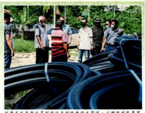
环境及水务部负责到偏远乡村检查供水管道，以确保村民享有干净卫生的水供。