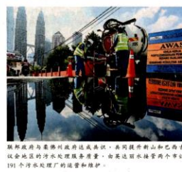
联邦政府与柔佛州政府达成共识，共同提升州属和巴西古当市议会的污水处理服务质量，由柔佛水环两个委员会共191个污水处理厂建设和维护。

联邦政府与柔佛州政府于今年10月达成共识，共同升级和提升山议会和巴西古当市议会的污水处理服务质量。 此项达成共识为大马半岛的整个污水系统协议。从今年12月1日启动，柔佛水环 (MWC) 将接管191个污水处理厂的建设和维护，其中山议会占147个，巴西古当则有44个，涉及总人口146万人。 柔佛水环也将为上述地区的29万3236个独立化粪池及化粪池提供净化服务。